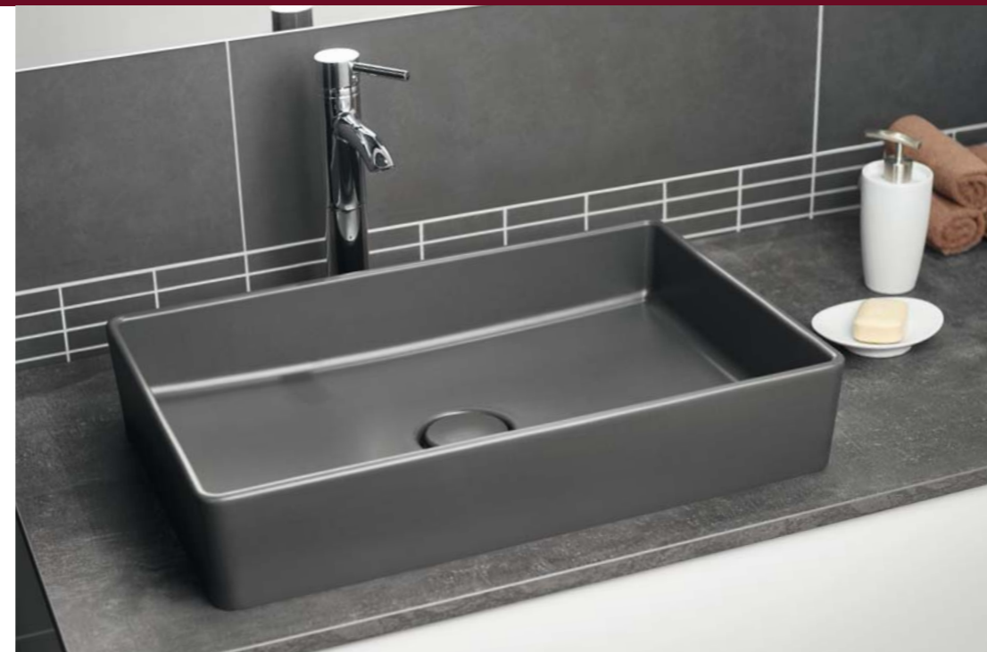
LAVARA 60 in Schiefer mit Waschtischarmatur BOZZ

Die RECHTECKIGEN WASHBECKEN , die 600 mm breit und 400 mm tief sind, entfalten eine großzügige Raumwirkung, die dank der schlanken, geraden Randeinfassung dennoch nicht zu dominant daherkommt.