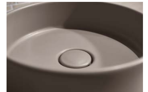
PATERA 40 in Schiefer mit Waschtischarmatur BOZZ

Fast unsichtbar wird das UNTEN EXTRA PLAN GESCHLIFFENE Becken einfach auf der Möbeloberfläche mit Silikon verbunden aufgesetzt. Das sieht edel aus und vereinfacht die Montage.