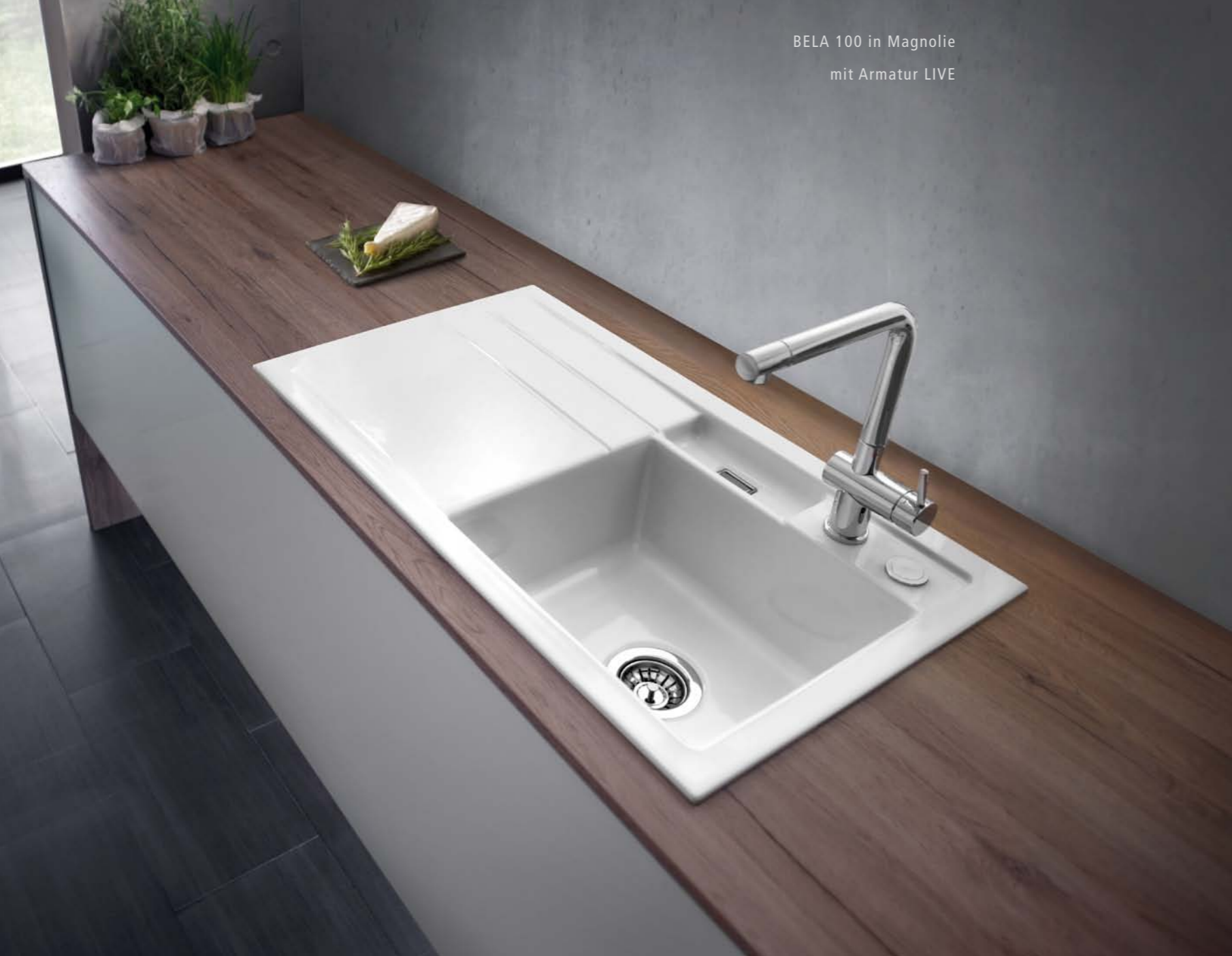
BELA 100 in Magnolie mit Armatur LIVE