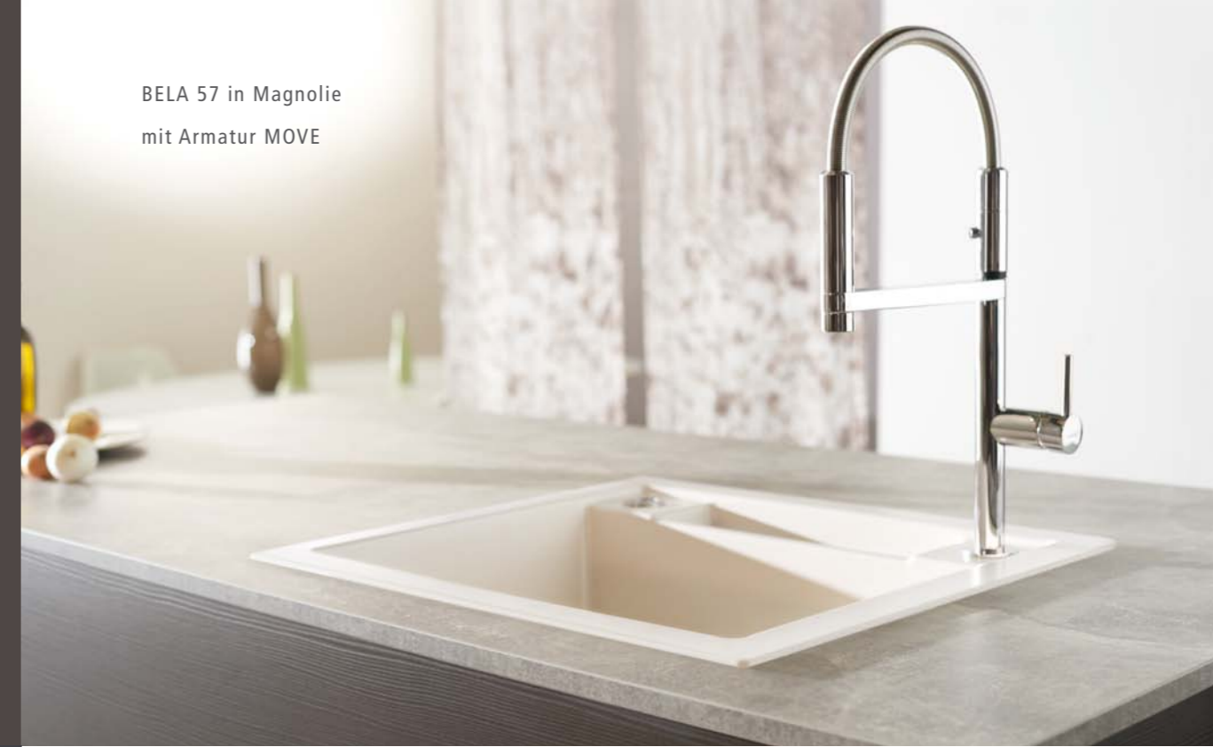
BELA 57 in Magnolie mit Armatur MOVE

Mit den schönen Proportionen, der elegant reduzierten Formensprache und der funktionalen Vielfalt erfüllt die BELA viele Wünsche an einen gut ausgestatteten Spülplatz. Als große Einbeckenspüle BELA 57 mit Armaturenbank und RESTEAUSSUSS MIT INTEGRIERTEM ÜBERLAUF reicht ihr nur ein Ausschnitt in der Arbeitsplatte für alles. Das ist attraktiv für die Planung mit Naturstein und eine schicke Lösung für moderne Kücheninseln.