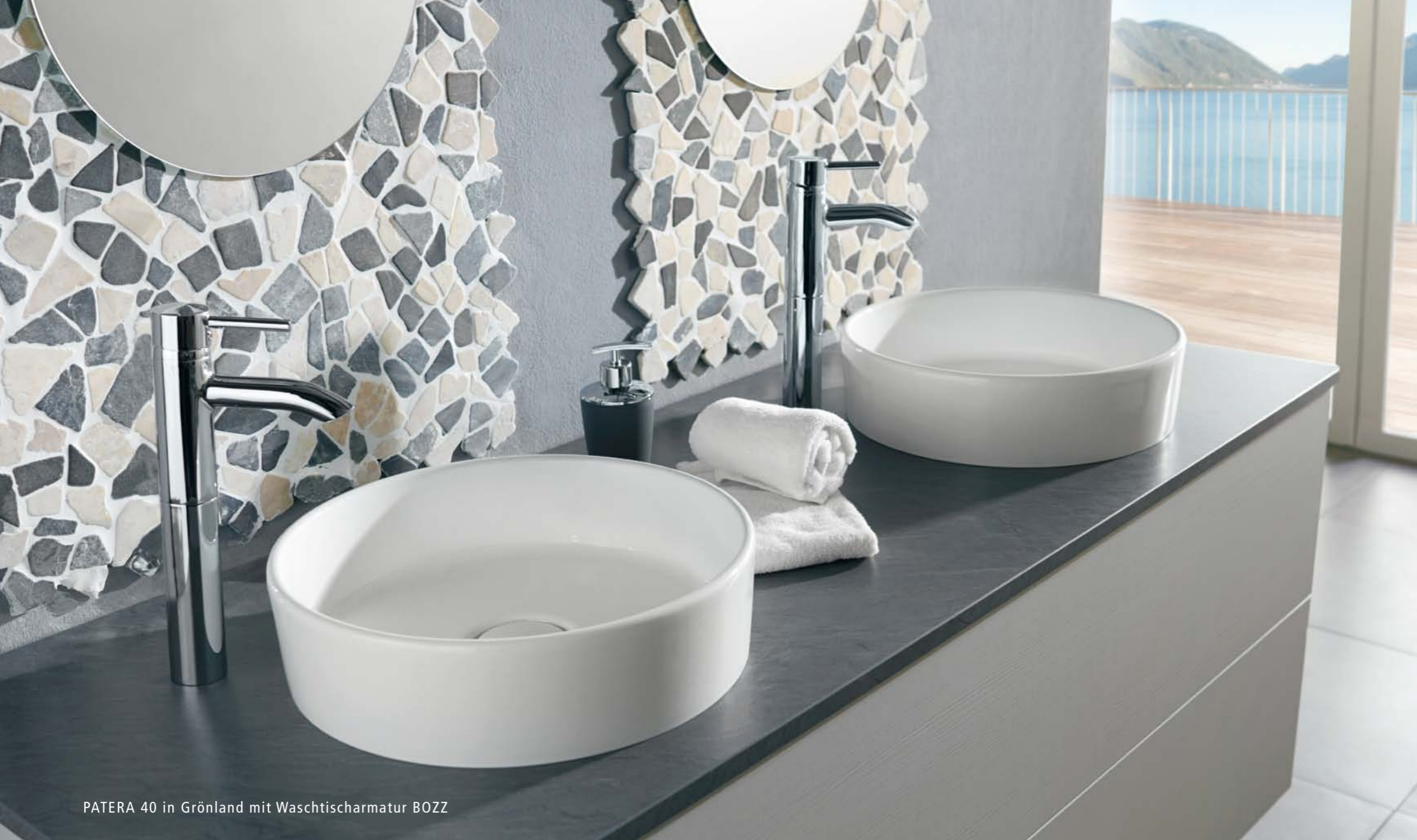
PATERA 40 in Grönland mit Waschtischarmatur BOZZ

Die neuen Becken sind in ihrer PURISTISCHEN SCHÖNHEIT über jeden Zeitgeist erhaben und gerade deshalb so gut kombinierbar mit Unterschränken nach eigenem Gusto. Die KREISRUNDEN BECKEN haben einen Durchmesser von 400 mm und eine Höhe von 100 mm. Diese Größe lässt Spielraum für Einrichtungskonzepte VOM GÄSTE- BIS ZUM FAMILIENBAD.